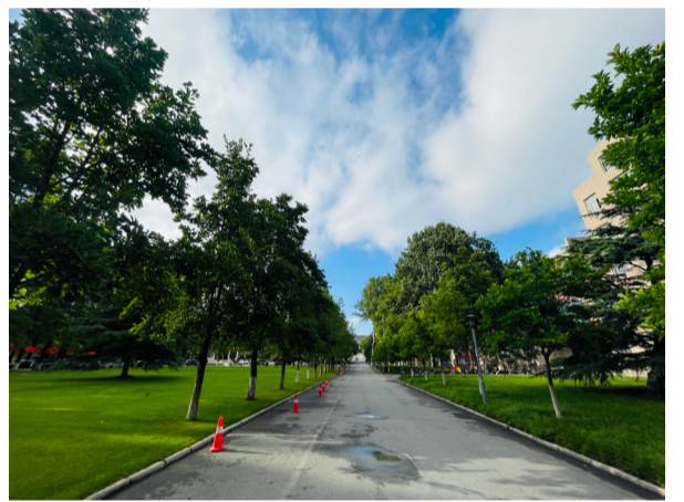
一路向前

如何去打破自身束缚的桎梏,冲破重重阻碍,找到方向,才是都市生活里,能证明自己活着的唯一方式。经历和感受会化作自我的安定,而不是在舒适圈里刨根究底,最后在被抛向未知时大众迎合。我时常在想人们常提“新青年”一词,这一词更是给予了属于我们现在青年人无线突破与进取的动力。尚且将我抛去,放入大我的视界里,人们崇尚的快乐也是有方向的,而我却单单属于那孔乙己的拘谨里,在可用的环境里,把握方向,才能走出无悔的路途。理想本就引导着前途,心中有觉悟才会正视时间线,春天会如期来到,青梅也会褪去青涩,是早是晚,靠的是实践力的付出,是自己对自己的重建。