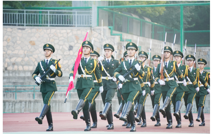
《五星闪耀皆为信仰》

“未来,源于今天的勇敢选择。放手去做,所有的伟大源于一个勇敢的开始。”新的未来,新的篇章,做更好的自己,努力拼搏,实现自我。